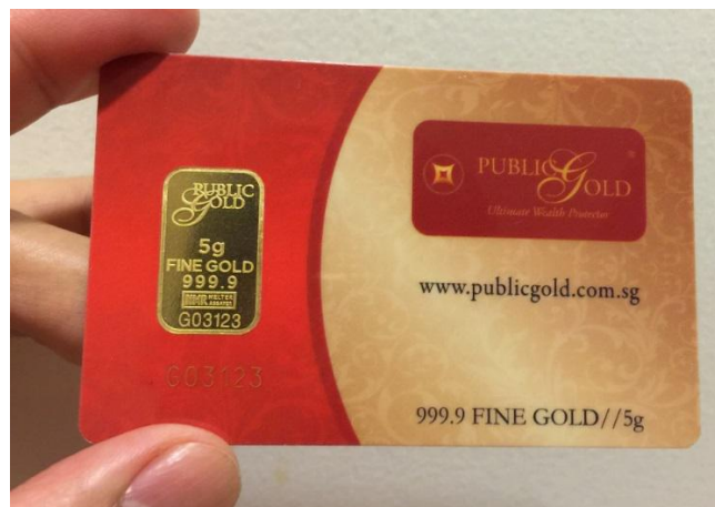
Gambar: Ini rupanya jongkong emas 5 gram.

Anda target untuk mendapat sekeping emas 5 gram yang cantik. Tengok gambar emas 5 gram kat bawah.